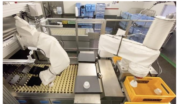
▲ANAC 羽田工場内のコンベア式洗浄機に設置された finibo